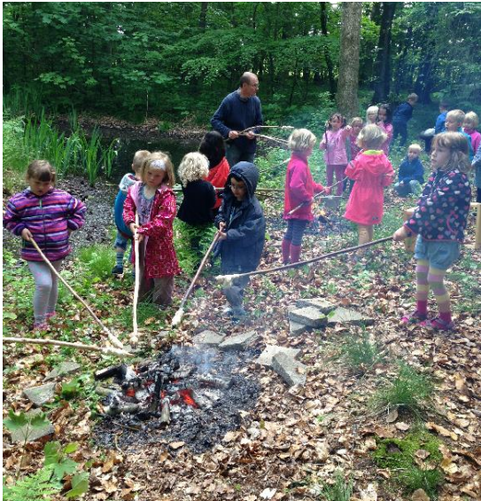
Natur, bål og hygge